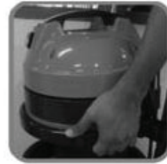
3. ใส่หัวเครื่องดูดฝุ่นกลับบนถึงฝุ่นสแตนเลสแล้วดันล๊อคเข้า