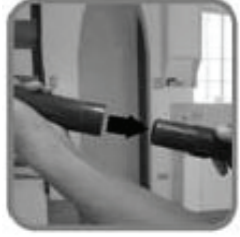
5. ใส่ท่อต่อเข้ากับสายท่อดูด