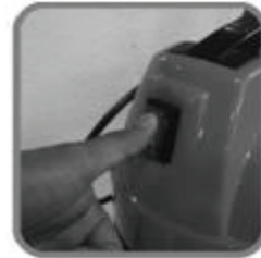
7. เสียบปลั๊ก 8. กดเปิดสวิตช์ 9. กดปิดสวิตช์หลังใช้งาน