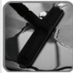
หัวดูดน้ำ สำหรับดูดพื้นเปียก