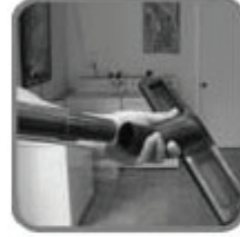
6. ใส่อุปกรณ์หัวดูดที่ต้องการ เช่น แปรงดูดพรม, หัวดูดน้ำ แปรงเล็ก, แปรงดูดร่อง