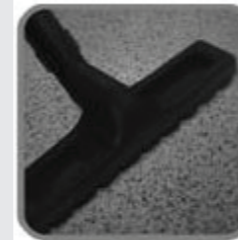
หัวแปรงเล็ก สำหรับทำความสะอาดเฟอร์นิเจอร์ ฉาก มุมอับ ฯลฯ