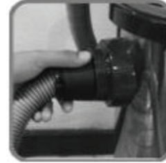
4. ใส่สายท่อดูดเข้าช่องดูดที่ตัวเครื่อง