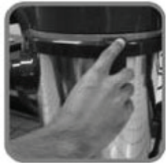
1. ถอดหัวเครื่องดูดฝุ่นออก โดยดึงล๊อคออก